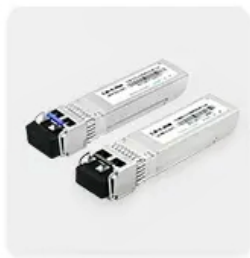
10G fiber optic module