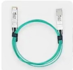
AOC Fiber Patch Cords