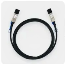
DAC Fiber Patch Cords