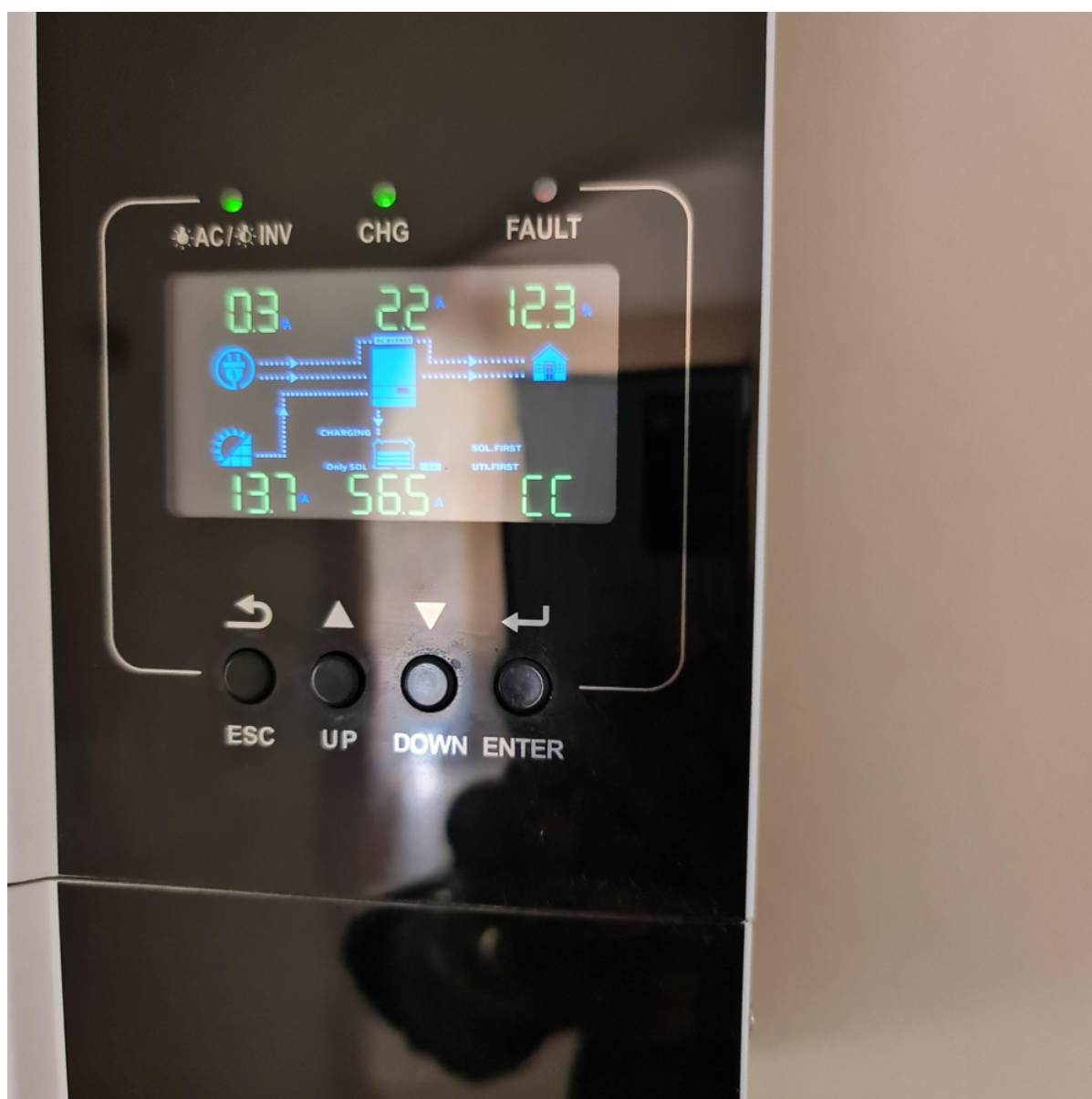
SPF 5000 ES verze (ilustrační foto)